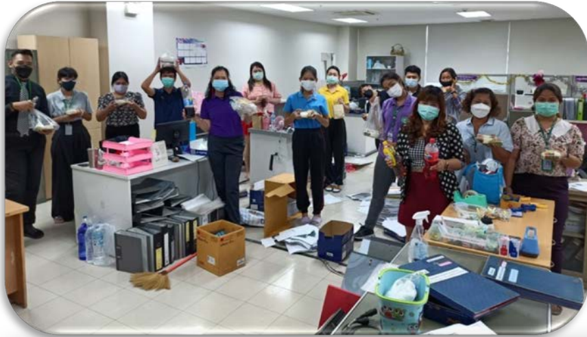
กิจกรรม 5 ส การคัดแยกขยะ